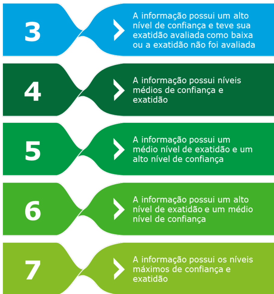
Figura 3 – Descrição das certificações atribuíveis às informações do SNIS